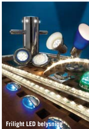
Frilight LED belysning