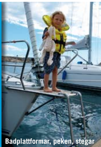
Badplattformar, peken, stegar