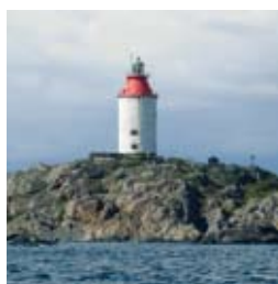
EL OCH BELYSNING